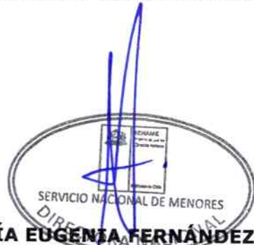
MARÍA EUGENIA FERNÁNDEZ A. DIRECTORA NACIONAL SERVICIO NACIONAL DE MENORES